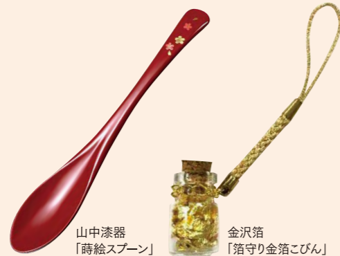
山中漆器「蒔絵スプーン」 金沢箔「箔守り金箔ごびん」