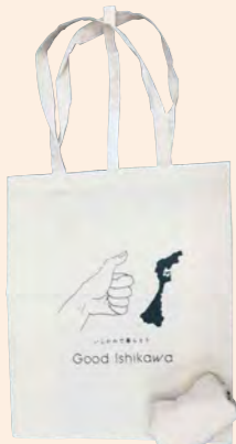
オリジナルトートバッグ